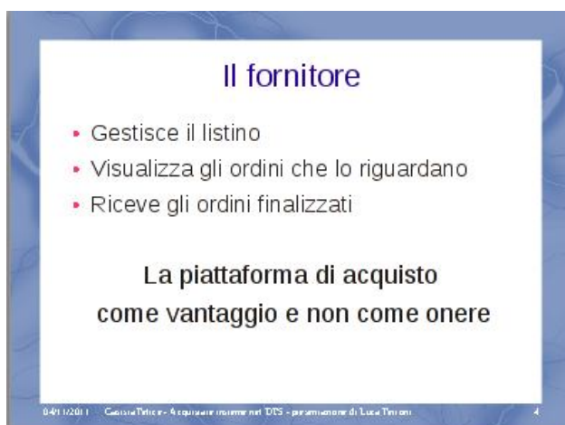
Figura 2: Le attività del fornitore

Ci sarebbe molto altro da dire su ogni punto. Accenniamo al fatto che ogni fornitore può associare le categorie dei prodotti che vende alle categorie predefinite del DES (es: Alimenti, Alimenti::Bevande::Analcoliche,